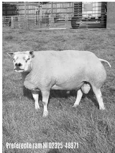
Preferente ram NI 02325-48971