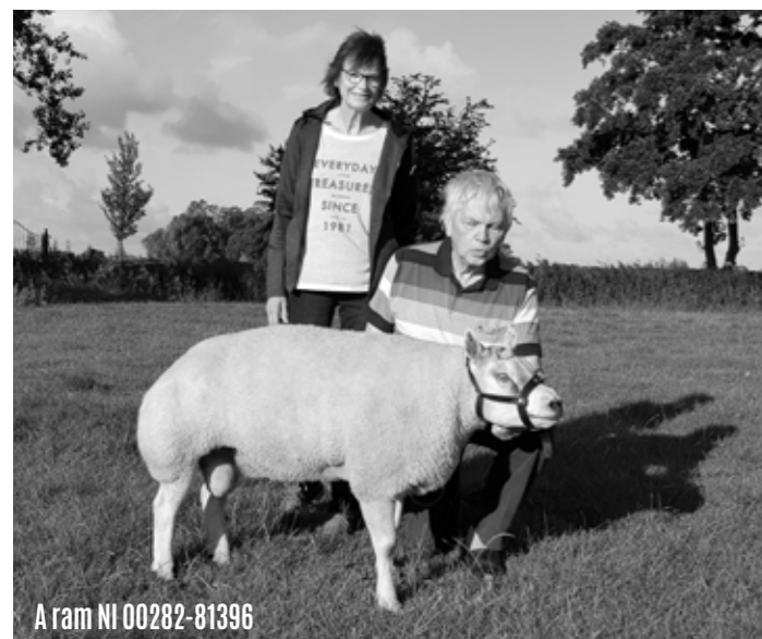
A ram NI 00282-81396