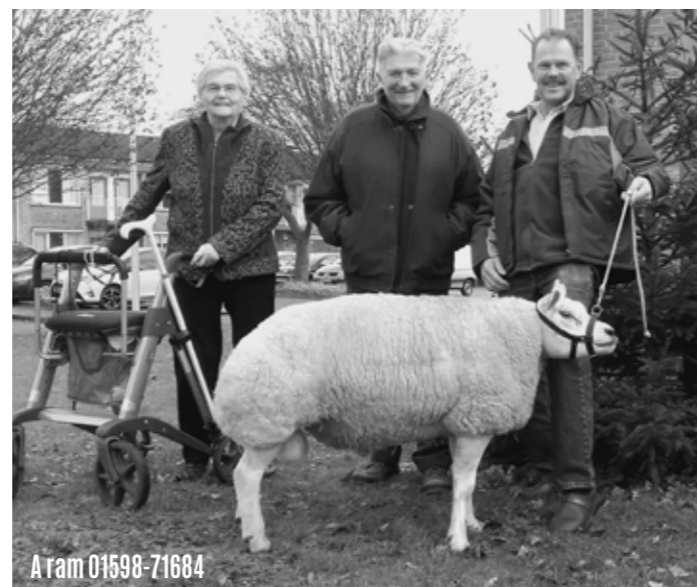
A ram O1598-71684