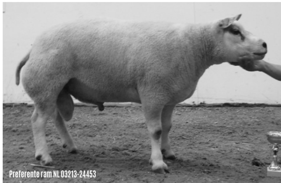
Preferente ram NL 03213-24453