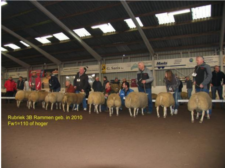
Rubriek 3B Rammen geb. in 2010 Fw1=110 of hoger