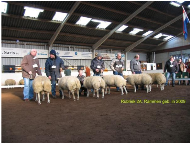
Rubriek 2A: Rammen geb. in 2009