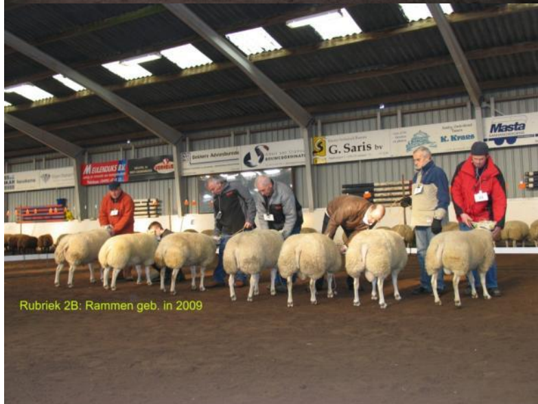
Rubriek 2B: Rammen geb. in 2009