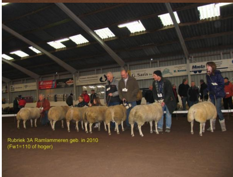
Rubriek 3A Ramlammeren geb. in 2010 (Fw1=110 of hoger)