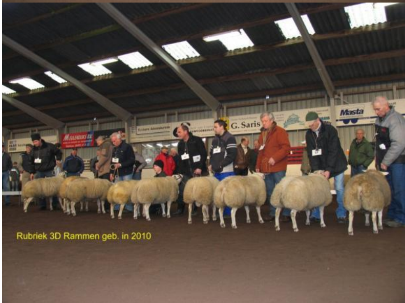
Rubriek 3D Rammen geb. in 2010