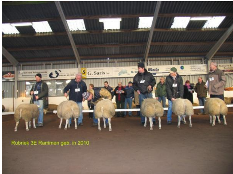
Rubriek 3E Rammen geb. in 2010