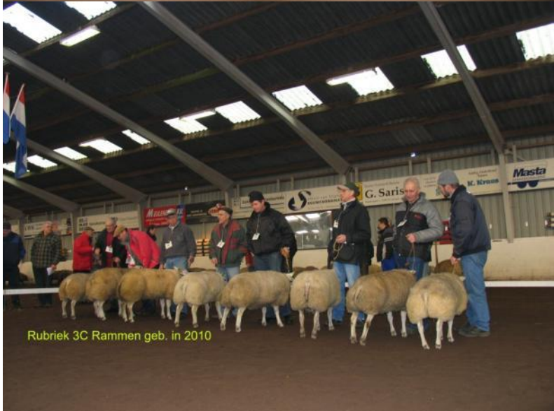
Rubriek 3C Rammen geb. in 2010